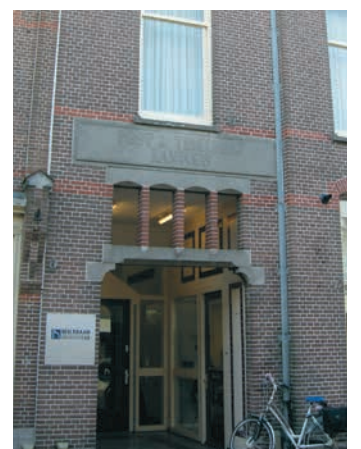
Prins Hendrikstraat 16

Deze wandeling is tot stand gekomen in samenwerking met Stichting Historische Kring Bodegraven en is mede mogelijk gemaakt door Graficelly, bureau voor marketing & media en gemeente Bodegraven-Reeuwijk.