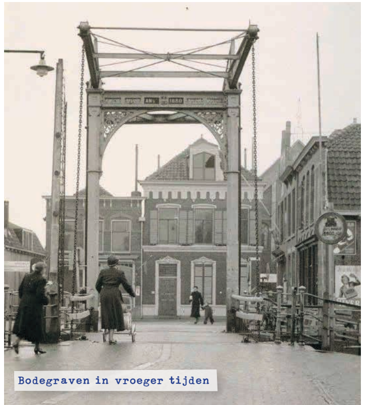
Bodegraven in vroeger tijden

Leuke tips voor recreatie in Bodegraven-Reeuwijk en omgeving